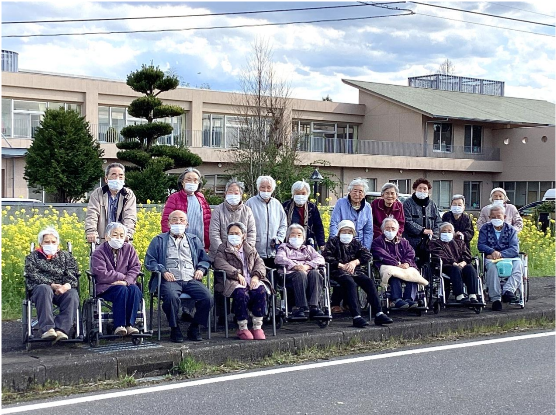
デイサービス利用者 菜の花の前で集合写真

社会福祉法人 加茂つくし会 特別養護老人ホーム 高滝神明の里 デイサービスセンター 高滝神明の里